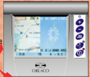
Bildschirm mit Informations-/ Routennavigationssystem