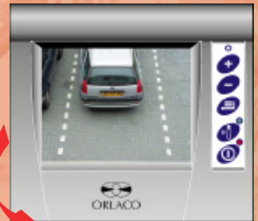
Heckkamera für die Sicht hinter das Fahrzeug