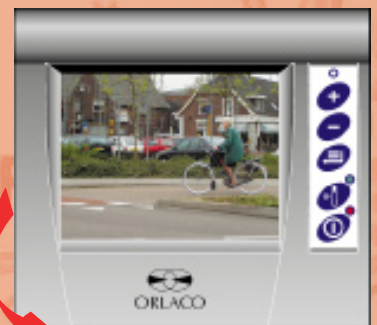
Seitenkamera für die Sicht rechts neben das Fahrzeug